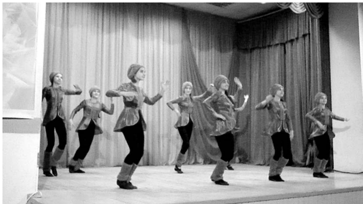
«Казачок» в исполнении «Росинки».

Любопытный момент отметил в своем поздравлении глава МР «Бабынинский район» А.И. Захаров. Еще несколько лет назад мы гордились таким понятием, как интернационализм. Когда представители разных национальностей трудились бок о бок, когда национальность не имела значения, люди были заняты единым делом. В последнее время это понятие трансформировалось, где-то больше, где-то меньше, но. Посмотрите на бабынинское село, представители