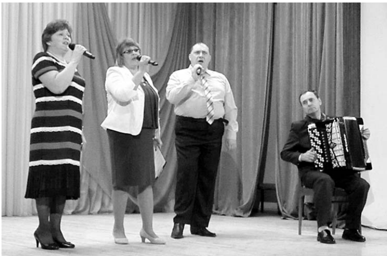
Поздравление от ансамбля «Ивушка».